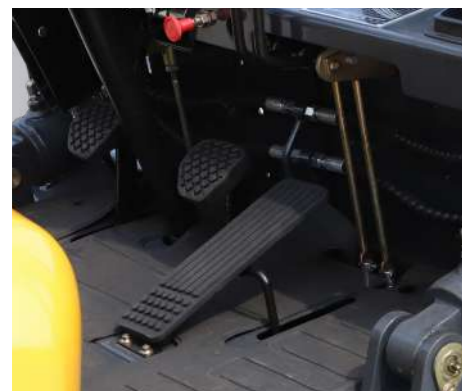
Увеличили педаль антипробуксовки