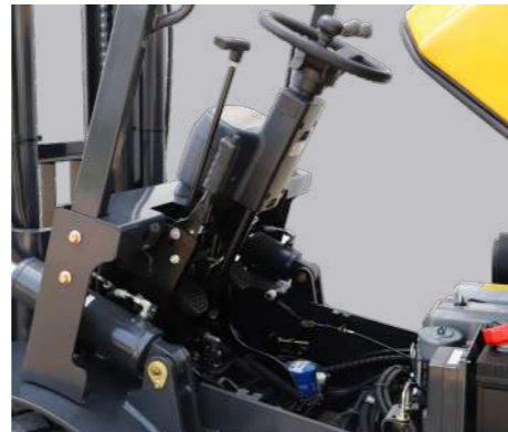
Интегрированная рулевая колонка