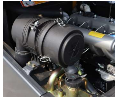
Воздушный фильтр с большим потоком