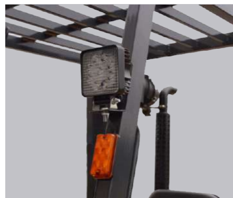
Светодиодные лампы повышенной надежности